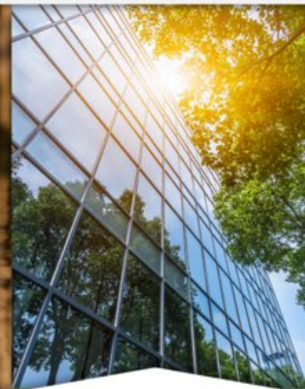
Participación del sector privado en la transición ecológica