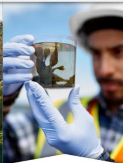
Generación y gestión del conocimiento