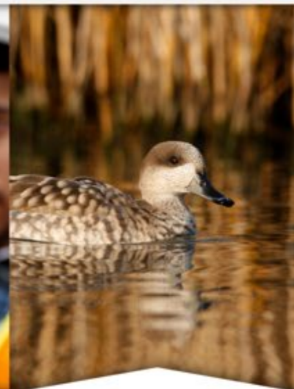
Motores de pérdida de biodiversidad