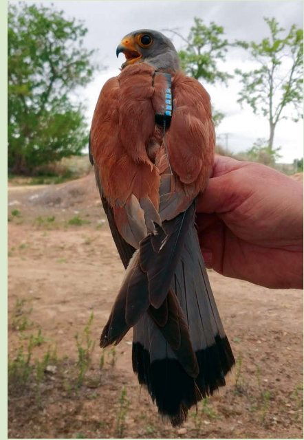
Macho de cernícalo primilla marcado con un datalogger por LIFE Estepas de La Mancha.

A través del marcaje de seis ejemplares con sensores de ubicación geográfica se han obtenido datos de las zonas de alimentación y de la ruta migratoria del cernícalo primilla. Además, el proyecto ha recuperado tres primillares -edificios antiguos abandonados que han sido acondicionados para albergar colonias reproductoras de esta especie- en los términos municipales toledanos de Lillo, Santa Cruz de la Zarza y Villacañas. También se ha instalado cinta o fleje anti-colisión alrededor de viñedos en espaldera de cinco municipios, para evitar el choque de las aves contra estas estructuras.