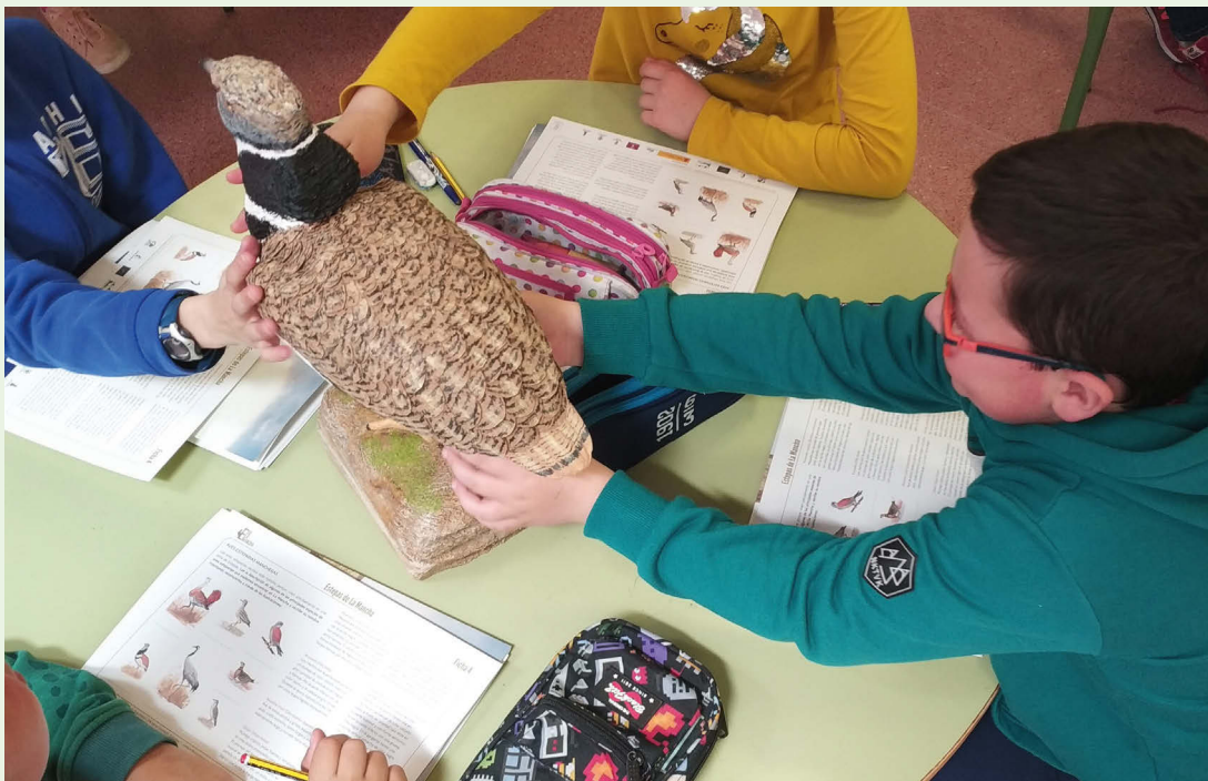
En la página anterior, macho de sisón común. Esta especie amenazada es una de las más seguidas por LIFE Estepas de La Mancha. En esta página, taller infantil con una réplica de sisón común, organizado por el citado proyecto europeo en un colegio de El Toboso (Toledo).

La estepa manchega es un ecosistema como pocos en el mundo, que debe su valor ecológico a la transformación del paisaje por la actividad agraria a través de los siglos. Este cambio milenar de la tierra ha derivado en un mosaico agrícola cuyo mantenimiento se hace necesario, entre otras razones, porque se ha convertido en uno de los pocos rincones en el que habitan especies de aves esteparias seriamente amenazadas como la avutarda ( Otis tarda ), el sisón ( Tetrax tetrax ), la ganga ibérica ( Pterocles alchata ) o el alcarrán ( Burhinus oedipnemus ).